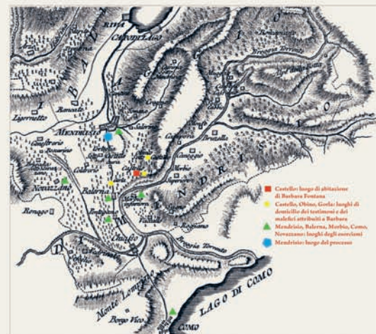
Carta di Pietro Neuronì (1781), riprodotta ed elaborata a partire dal facsimile pubblicato in Archivio storico ticinese 24 (1965), p. 222.